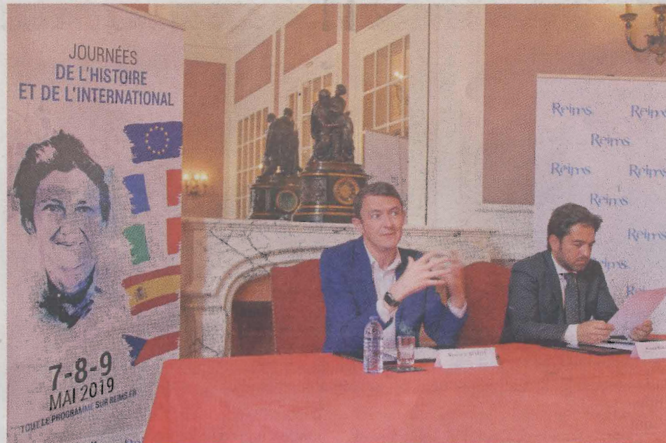
Cette 6e édition des Journées de l'histoire et de l'international rendront un hommage particulier à Simone Veil.