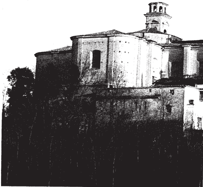
Castiglione delle Stiviere (Chiesa Maggiore)