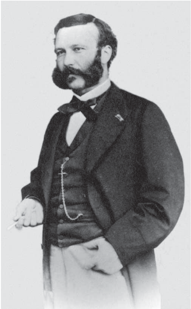
J.-Henry Dunant (1828–1910)