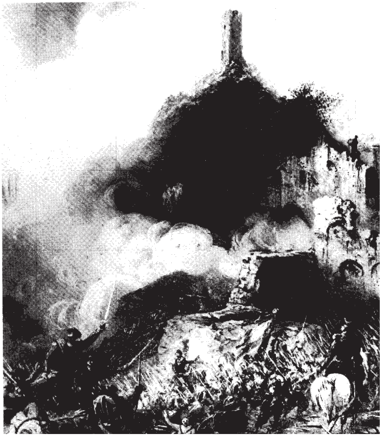
A l'assaut de Solférino