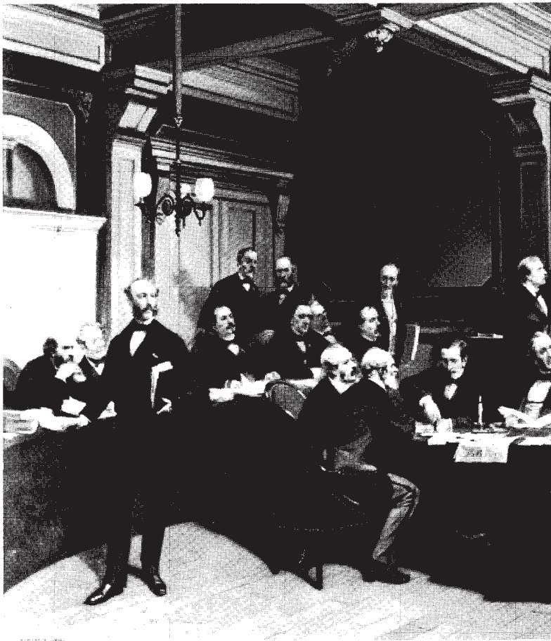
Conférence diplomatique en 1864 à Genève