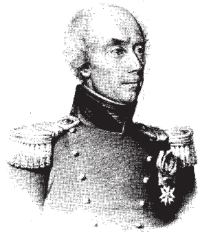
Commission dite «des Cinq»