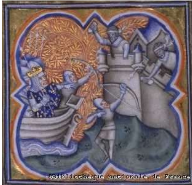
Prise de St Jean d'Acrc

En 1190, Philippe Auguste part pour la 3ème croisade.