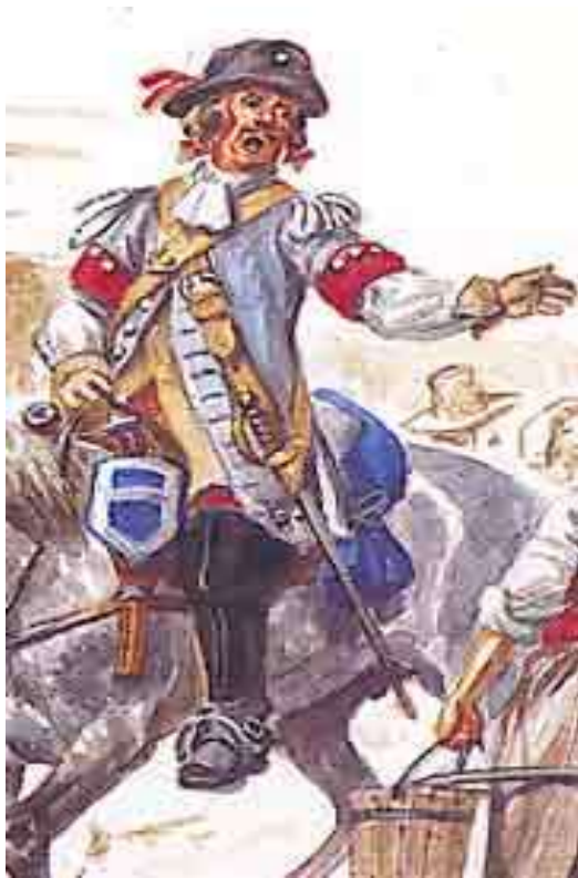
Archer en 1470

En 1536, François Ier étend, partiellement, les missions de la Maréchaussée à la police des personnes.