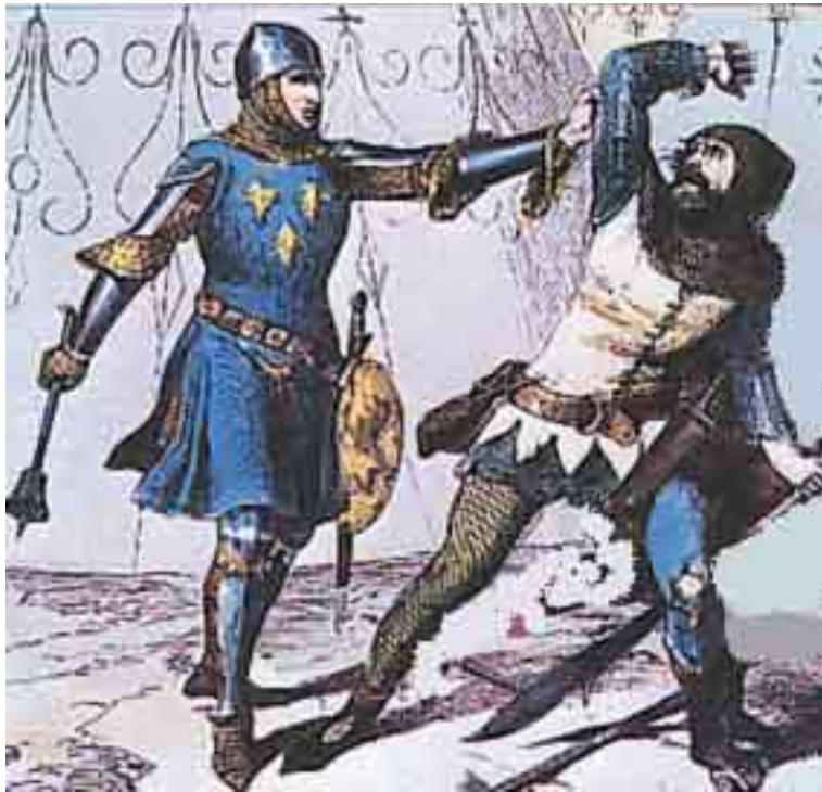
Sergent d'armes sous Philippe Auguste

La Maréchaussée, dès le moyen âge, est un corps de militaires chargé de justice et de police aux armées.