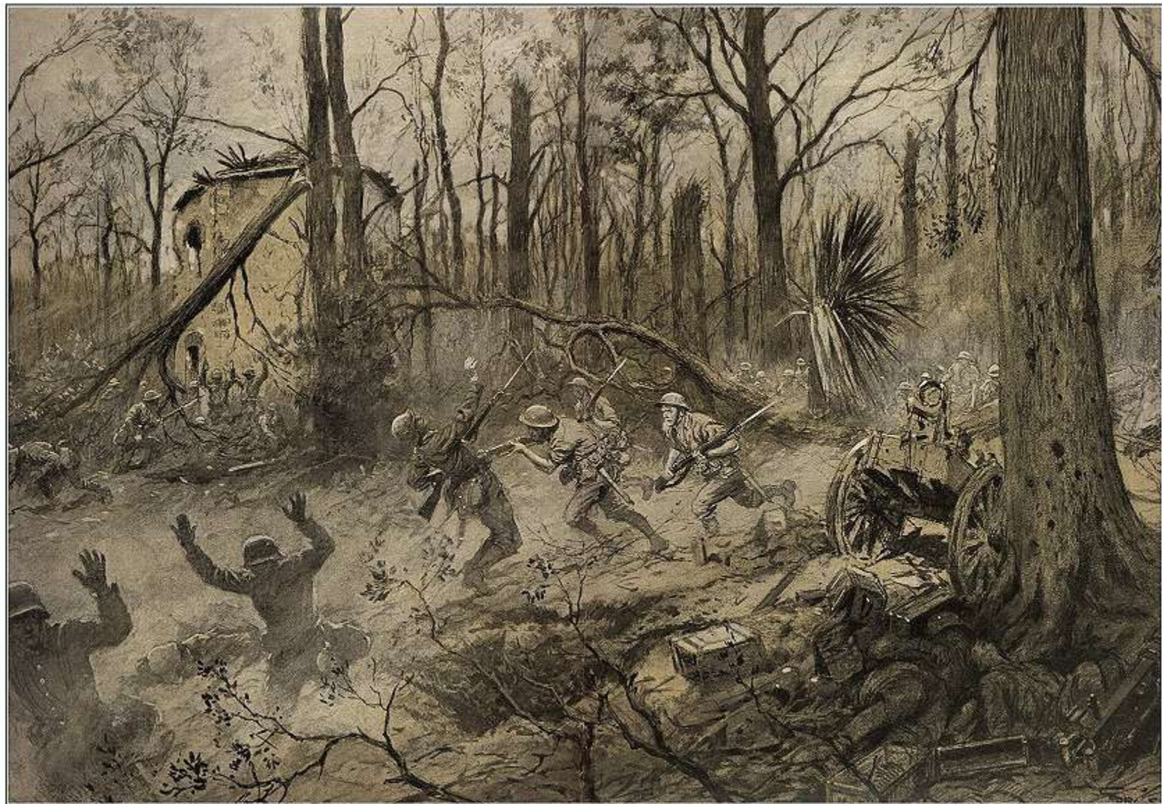
LA BRIGADE MARINE AMERICAINE AU BOIS DE BELLEAU