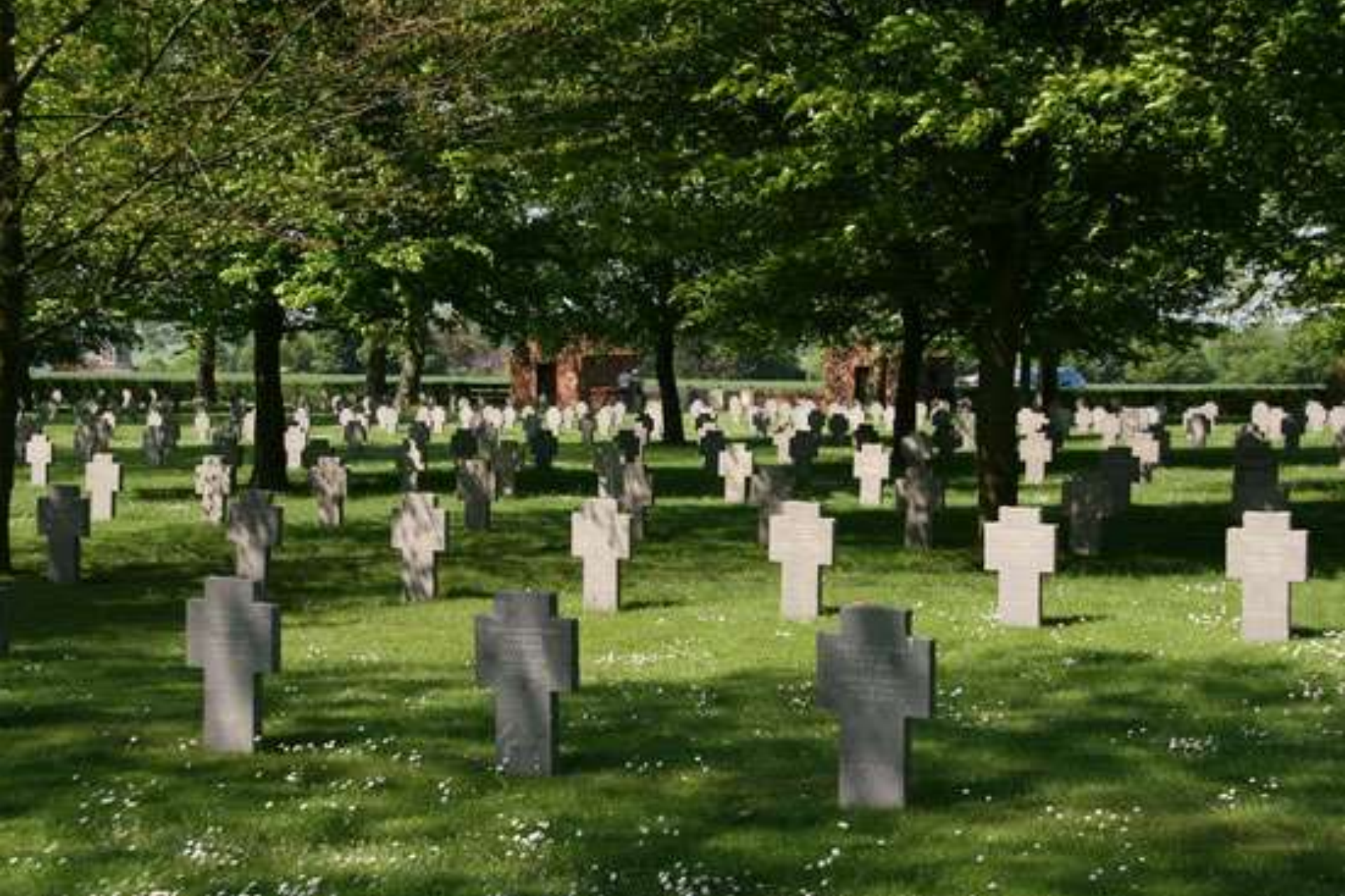
Cimetière allemand de Belleau