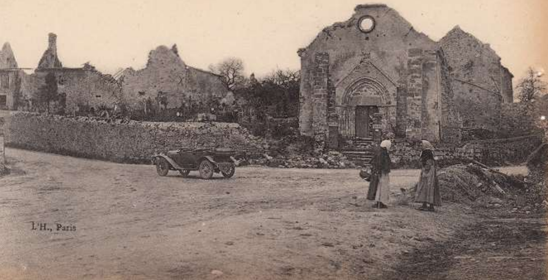
Bataille de la Marne (1918) — BOURESCHES Aisne; Place de L'Église — Church Place