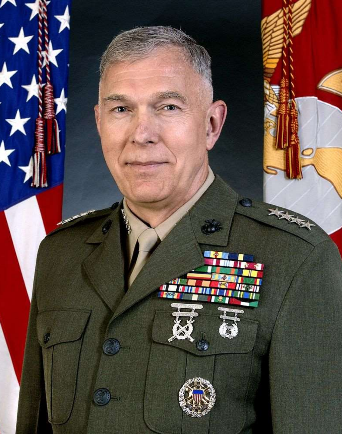
Général James Terry Conway 1947 -