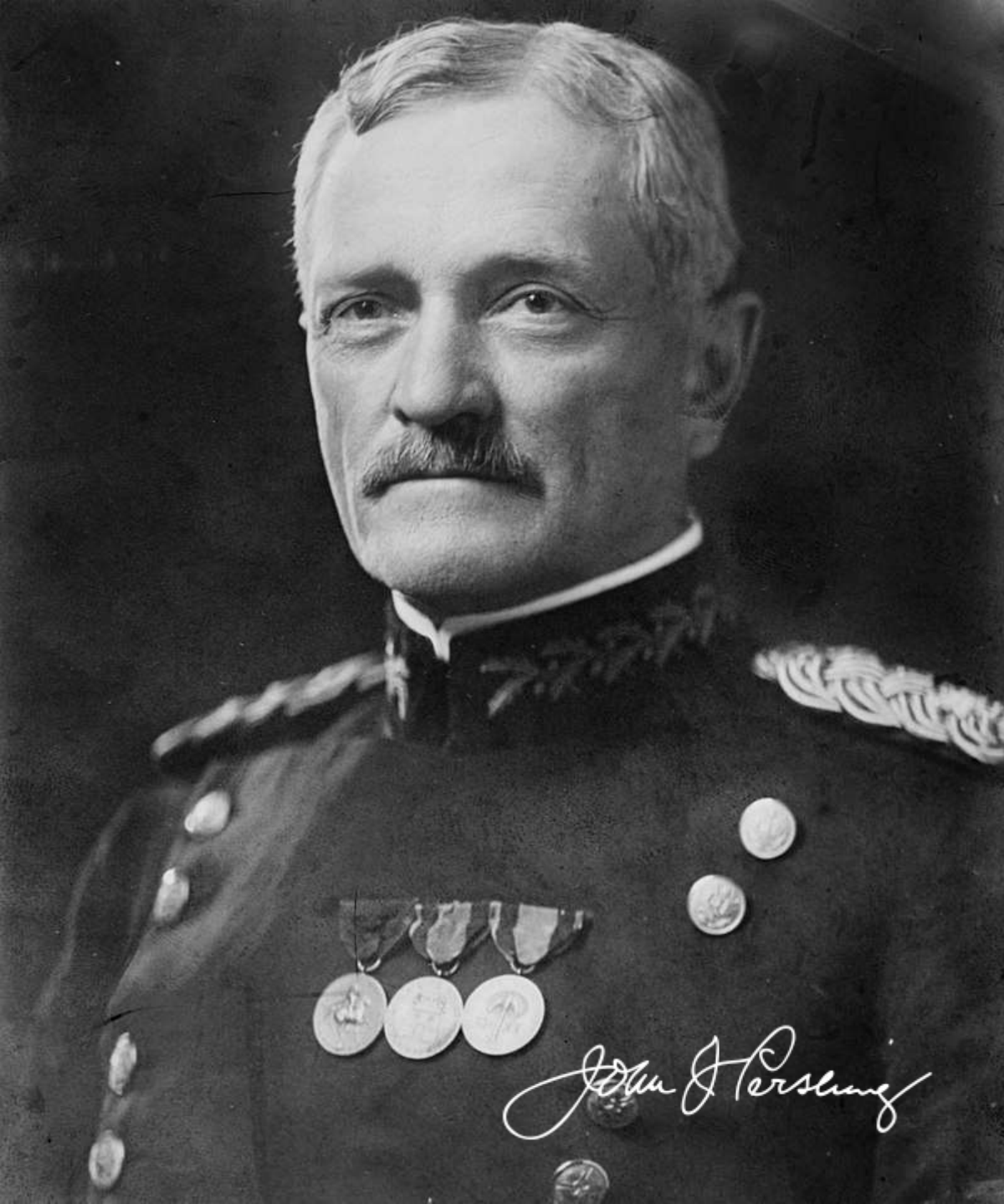
Général John Joseph Pershing 1860 - 1948