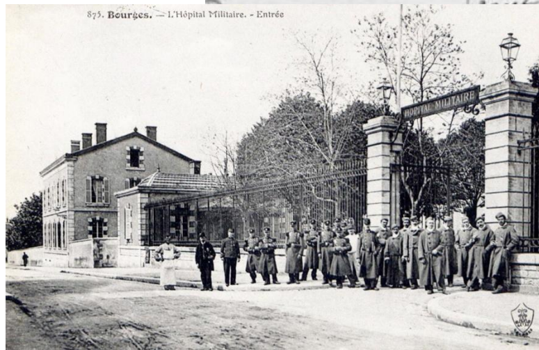
875. Bourges. — L'Hôpital Militaire. — Entrée