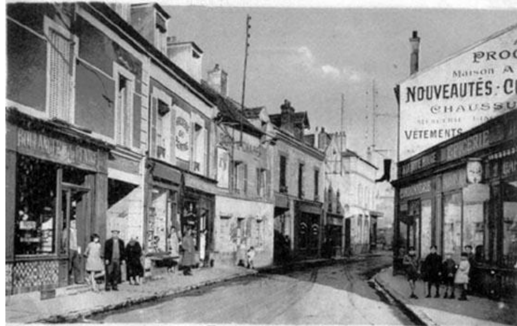
Houilles — Rue de Paris