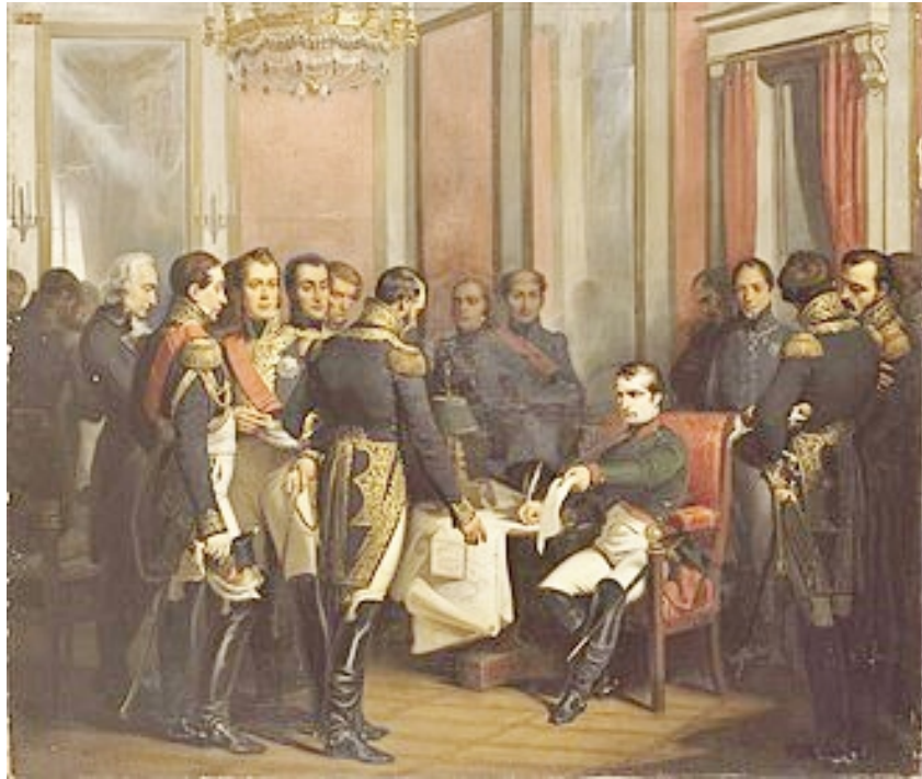
Abdication le 4 avril 1814