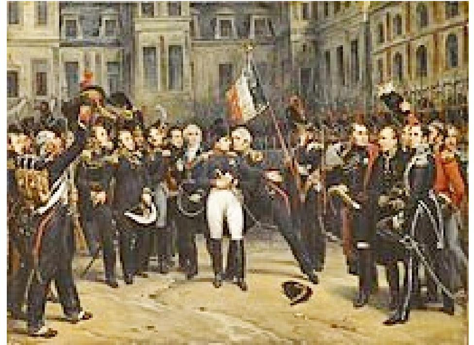
Le 20 avril il fait ses adieux à la Garde Impériale

Le 29 avril départ de Saint Raphaël pour l'exil à l'île d'Elbe