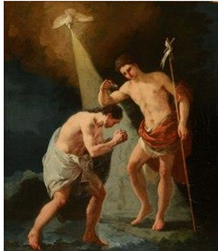
Baptême du Christ Francisco de Goya 1780

Nous sommes le 24 juin, fête de la nativité de Saint-Jean-Baptiste.